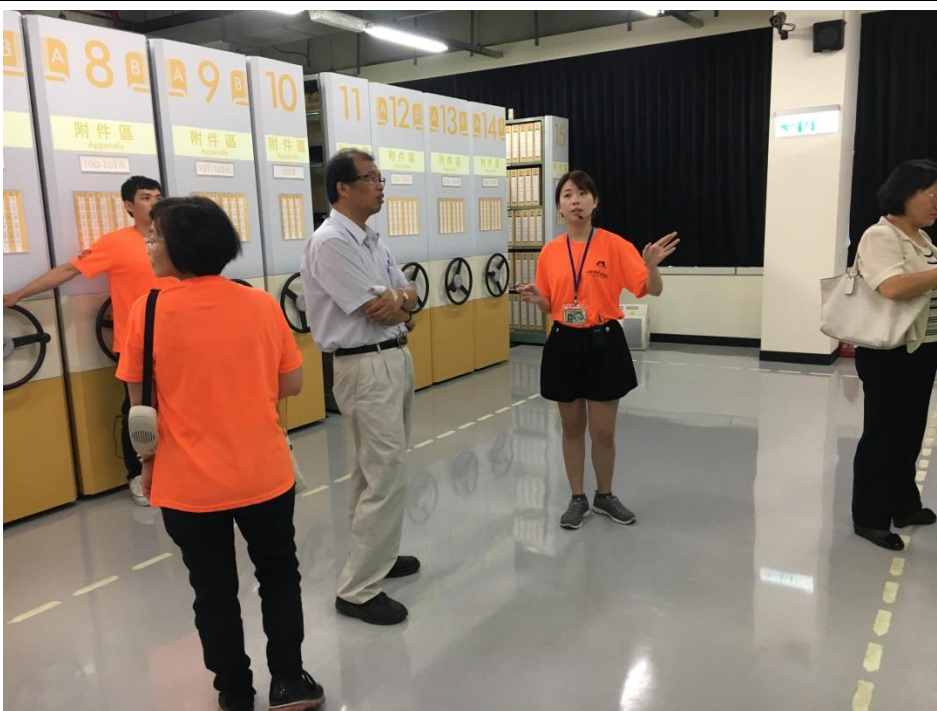
內容說明：所長認真聆聽庫房解說。