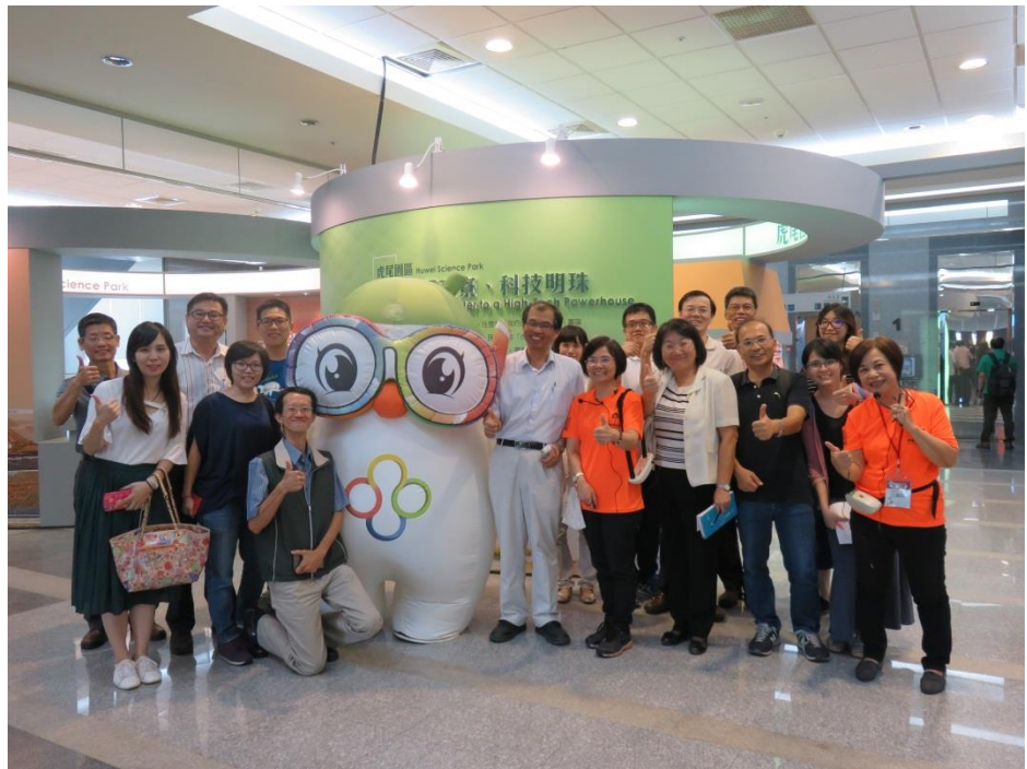
活動 照片 1

各分組成員及各課室成員，分別就該局辦理教育訓練、檔案立案編目、檔案管理、庫訪設施、檔案應用及文書與檔案作業資訊化等作業一一請益。