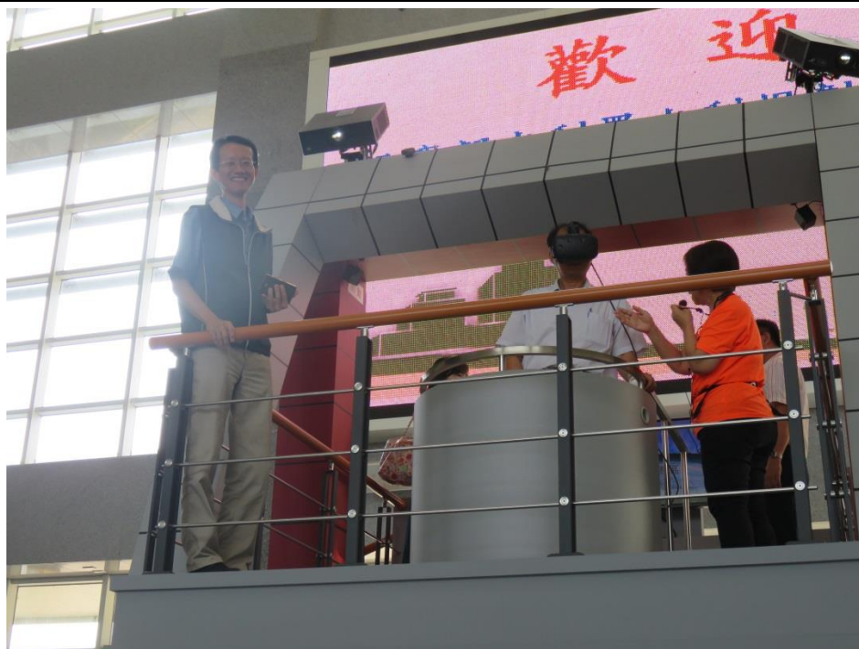
活動 照片 2