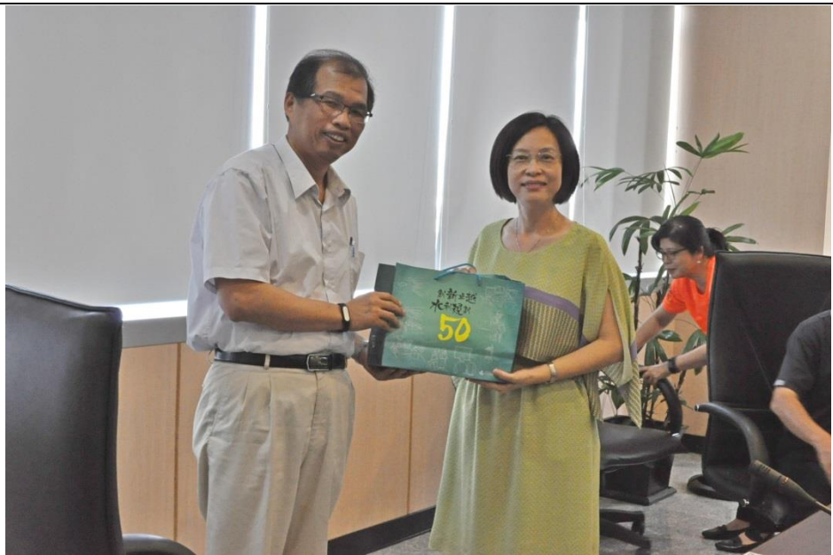
內容說明：所長致贈該局林主秘梅綉本所宣導品。