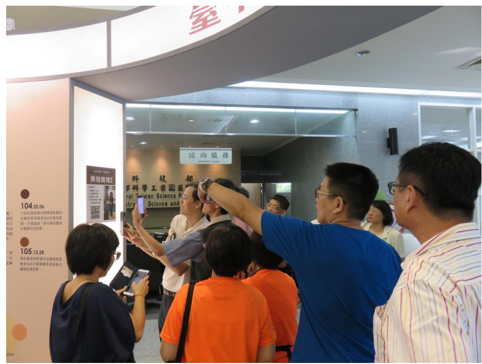
內容說明：體驗該局常設展之一隅-掃描 QR code 下載擴增實境 APP