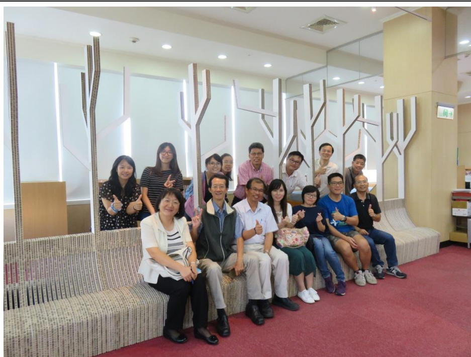
內容說明：當天活動剪影。